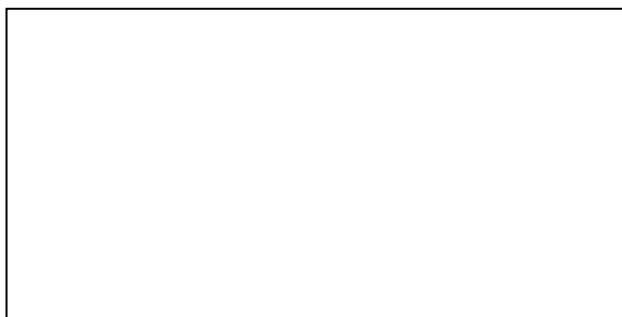
Quadro 1 – Título